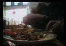
Excerpts from Thumbnail Express