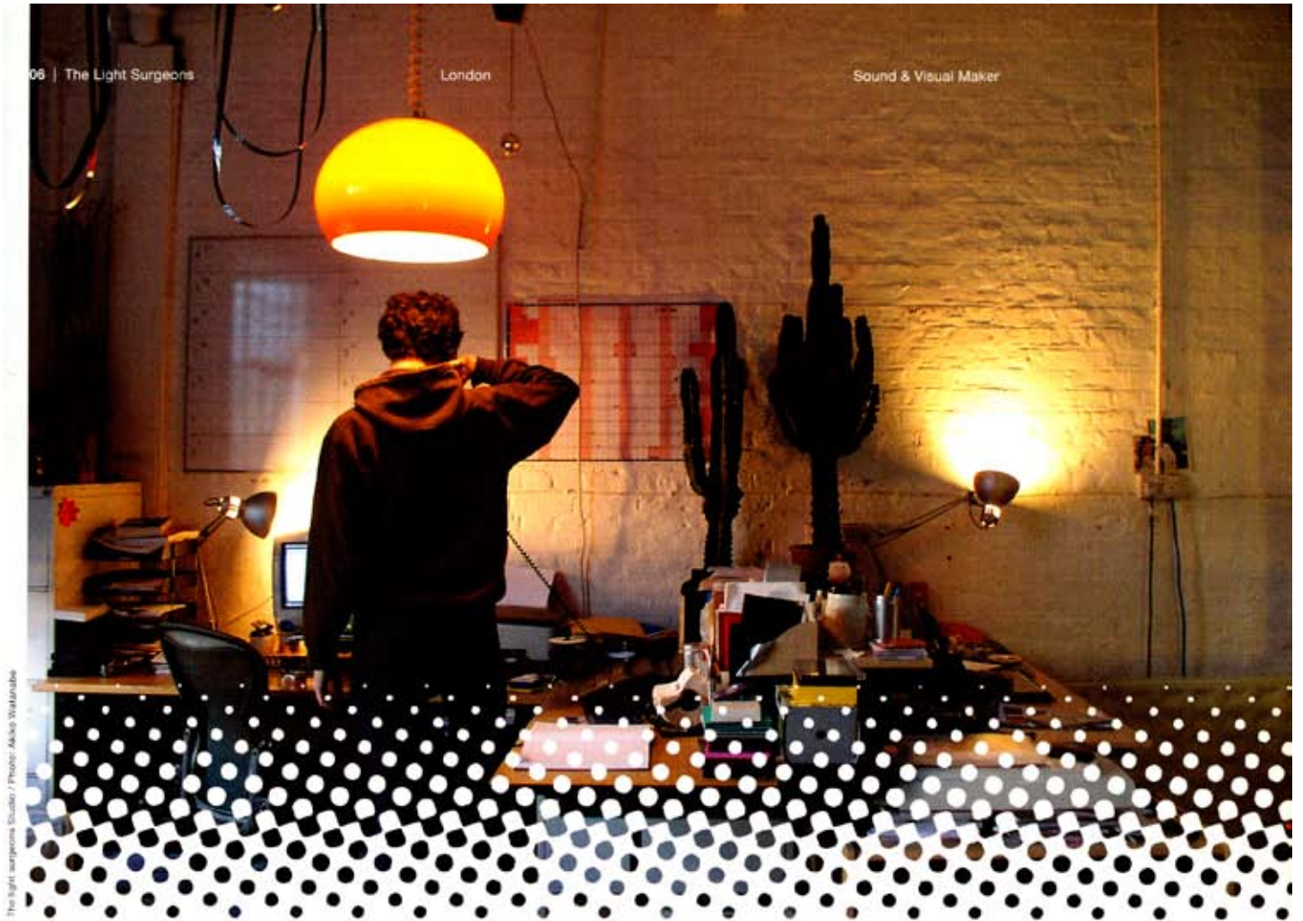
The Light Surgeons Studio