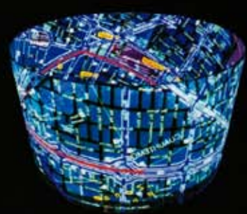
Excerpts from Grande Hotel Salone-Ron Arad